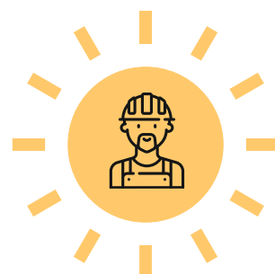
SZABADBAN FIZIKAI MUNKÁT VÉGZŐK